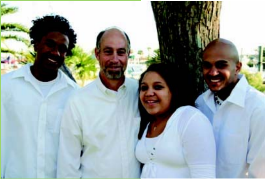
دليل للأطفال والشباب