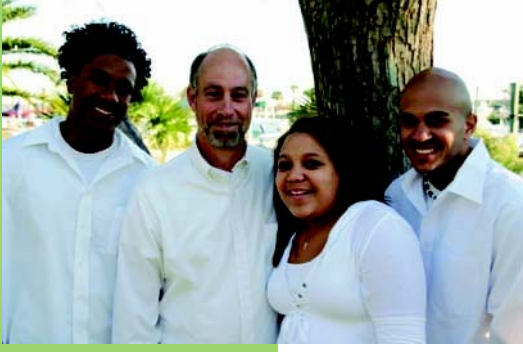
دليل للأطفال والشباب